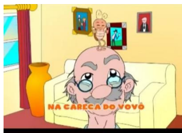
BARATA NA CARECA DO VOVÔ